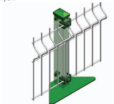
Krata 3D, drut 5+4

3. Odpowiednio rozmieszczone haczyki pozwalają na skokowe stopniowanie każdej kraty, dzięki czemu system jest przystosowany do terenów nierównych.